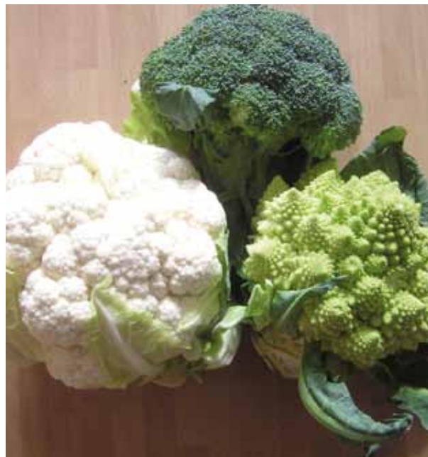
LE CHOU-FLEUR, MUTANT DU CHOU, A PRODUIT DE NOUVEAUX MUTANTS TELS LE BROCCOLI ET LE ROMANESCO

Les mutations ont joué un rôle primordial dans l'évolution des espèces végétales et animales depuis le début de la vie sur terre. À partir du néolithique, l'agriculture a