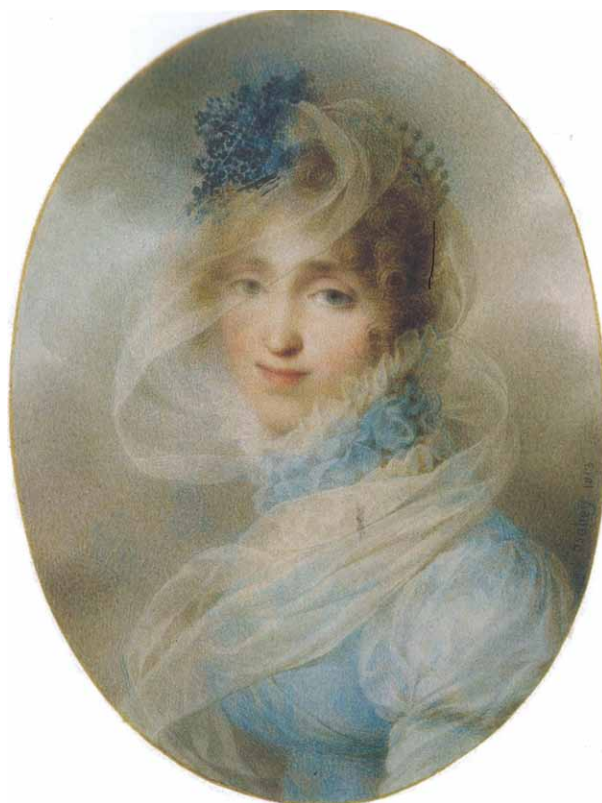
L'HORTENSIA TIRERAIT-IL SON NOM DE CELUI DE LA REINE HORTENSE (PORTRAIT PAR JEAN-BAPTISTE ISABEY)?