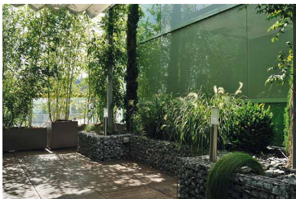
UN MASSIF DÉLIMITÉ PAR DES GABIONS : AVANT DE VOUS LANCER, VÉRIFIEZ LE POIDS QUE PEUT SUPPORTER VOTRE TERRASSE !