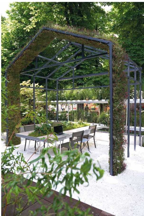
POUR UNE TONNELLE OU SUR UN MUR VÉGÉTAL, LA PALETTE DE PLANTES EST VASTE

Parmi les plantes d'ombre ou mi-ombre : rhododendrons et azalées, « avec l'extraordinaire beauté de leurs fleurs