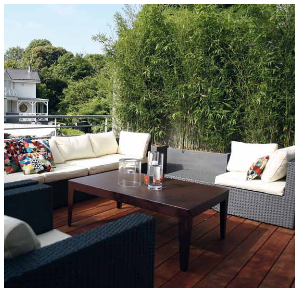
LE BAMBOU EST UNE PLANTE APPRÉCIÉE COMME ÉCRAN MAIS ATTENTION AU DÉVELOPPEMENT DE SES RACINES QUI PEUVENT ÉMERGER DES JARDINIÈRES !

* Les Jardins de Gally Trois agences: Lyon, Grenoble, Annecy www.lesjardinsdegally-ra.com