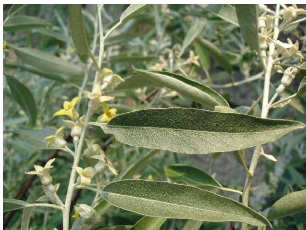
TRADITIONNEL, L'ELAEAGNUS ANGUSTIFOLIA A TOUTE SA PLACE SUR UNE TERRASSE