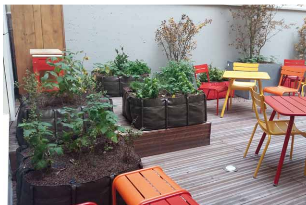
LES CONTENANTS PEUVENT ÊTRE CLASSIQUES MAIS OSEZ ÉGALEMENT L'ORIGINALITÉ !