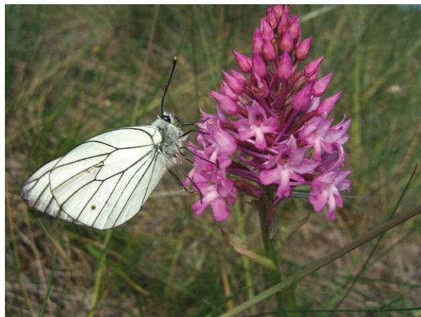
FIGURE 2. UN PAPIILLON GAZÉ EN TRAIN DE POLLINISER L'ORCHIS PYRAMIDAL EN ALLANT CHERCHER AVEC SA TROMPE LE NECTAR AU FOND DU LONG ÉPERON DE LA FLEUR

Que l'insecte soit attiré par naïveté ou qu'il recherche sa nourriture ou son partenaire sexuel, c'est l'orchidée qui exploite à son compte ses différents comportements.