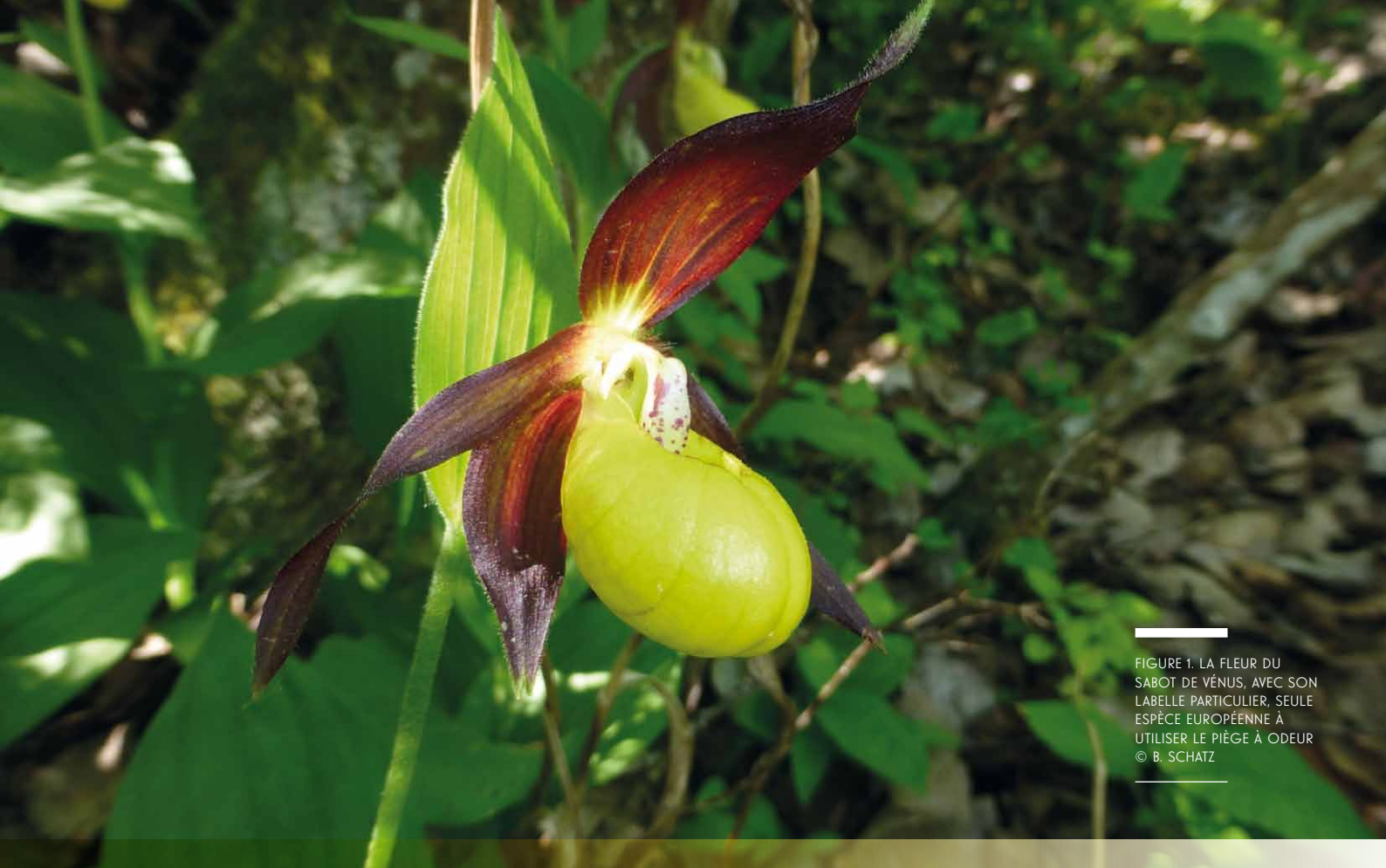
FIGURE 1. LA FLEUR DU SABOT DE VÉNUS, AVEC SON LABELLE PARTICULIER, SEULE ESPÈCE EUROPÉENNE À UTILISER LE PIÈGE À ODEUR