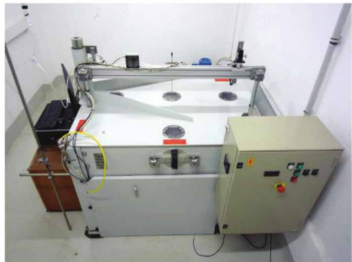
FIGURE 3. LE DERNIER-NÉ DES CAVITRONS DESSINÉ POUR MESURER DES ESPÈCES À VAISSEAUX TRÈS LONGS: LE CAVI1000