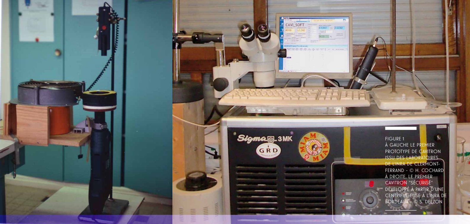
FIGURE 1 À GAUCHE LE PREMIER PROTOTYPE DE CAVITRON ISSU DES LABORATOIRES DE L'INRA DE CLERMONT- FERRAND À DROITE, LE PREMIER CAVITRON "SÉCURISÉ" DÉVELOPPÉ À PARTIR D'UNE CENTRIFUGEUSE À L'INRA DE BORDEAUX