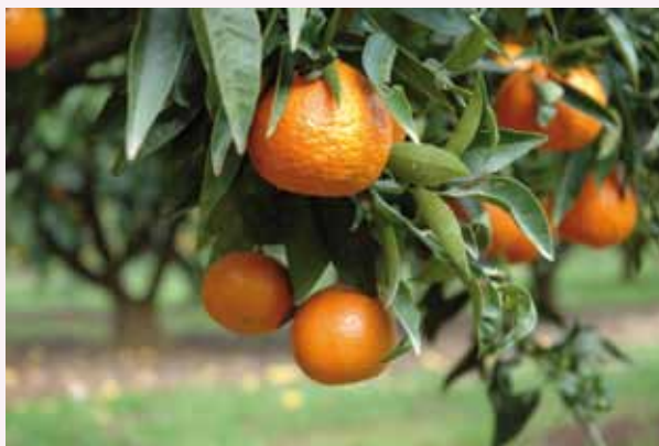
LE CLÉMENTINIER EST UNE COMBINAISON UNIQUE DE DEUX GÉNITEURS QU'IL EST PEU PROBABLE DE REPRODUIRE. ICI, UN VERGER DE PRODUCTION

Plus tard au début du XX e , en hommage à son découvreur cet arbre fut nommé Clémentinier et ses fruits clémentine. Si l'origine maternelle du clémentinier était certifiée en revanche l'identité du pollinisateur fut longtemps méconnue. Grâce aux outils de la biologie moléculaire à la fin du XX e siècle, l'intrus fut découvert : l'oranger est le parent mâle du clémentinier ! Bien que ses parents soient tous deux doués de reproduction non sexuée (polyembryonie), le clémentinier ne produit des graines qu'avec un seul embryon, celui résultant de la fécondation. Comme par ailleurs ses parents sont génétiquement diversifiés, le clémentinier est une combinaison unique des deux géniteurs qu'il est peu probable de reproduire. Par conséquent la seule manière de préserver le clémentinier et de le multiplier, est la pratique du greffage ou une autre technique horticole (bouturage et marcottage).