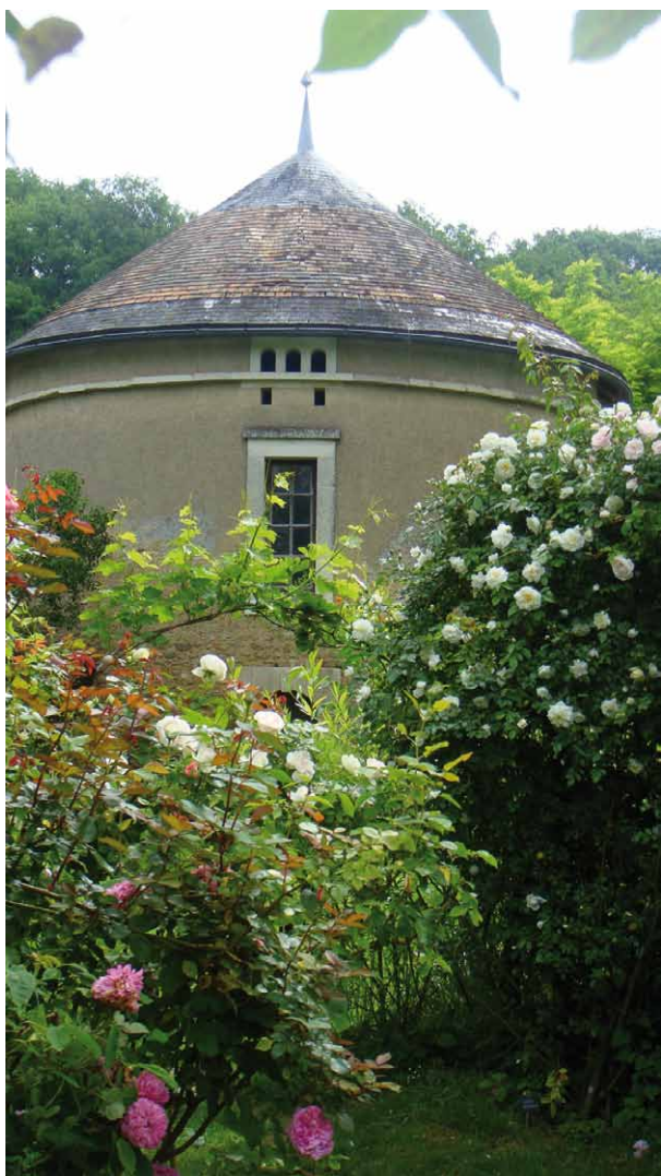
UNE ALLÉE À LA VÉGÉTATION EXUBÉRANTE

De l'autre côté du ruisseau, le potager en carrés présente des légumes anciens et une collection de chardons. Les cornichons sauteurs surprennent petits et grands dans ce lieu enchanteur.